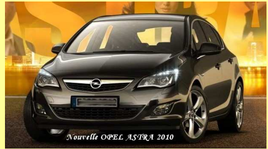
Nouvelle OPEL ASTRA 2010

DEPANNAGES TOURISMES & UTILITAIRES REPARATIONS TOUTES MARQUES MECANIQUE - TOLERIE - PEINTURE - MARBRE VENTE VEHICULES NEUFS & OCCASIONS